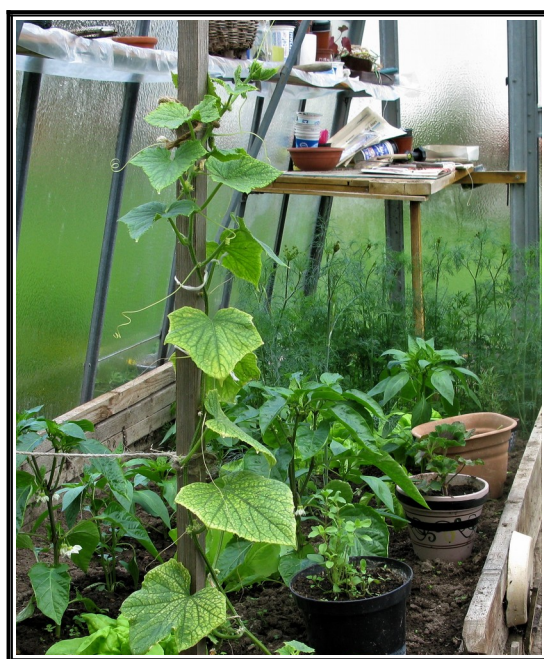
Brambory již kvetou, Okurky jsem již bral, ale nějak přestaly růst