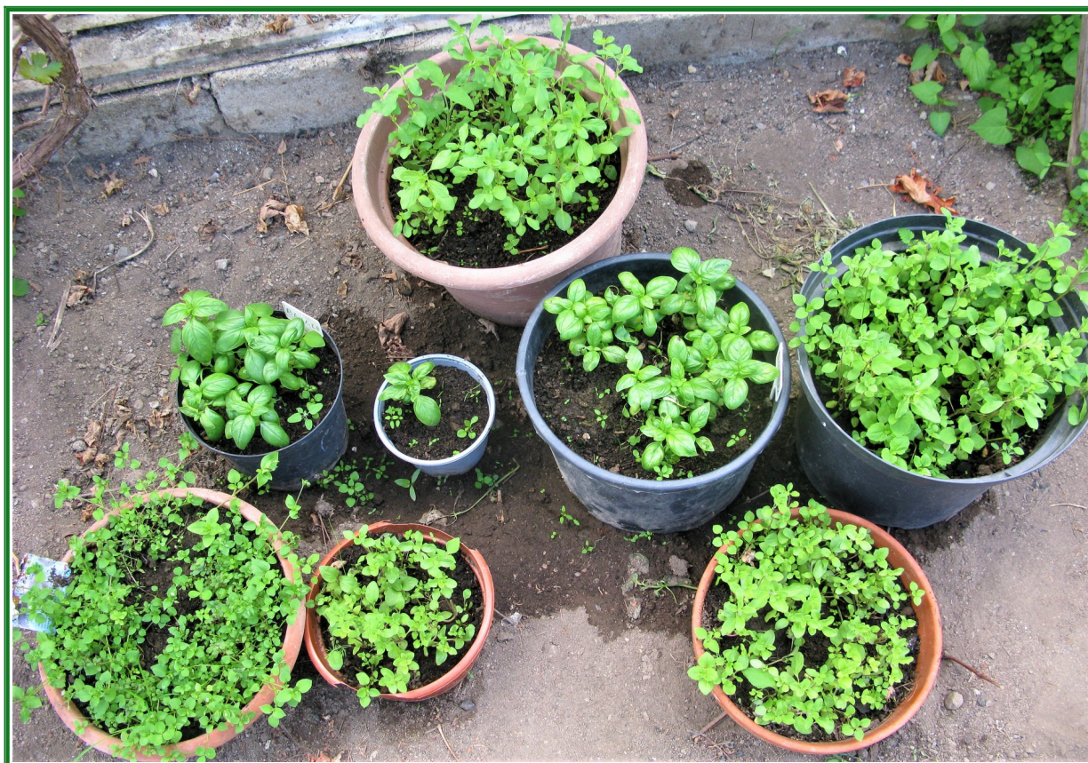
Moje léčivé a kuchyňské rostlinky. Majoránka, bazalka a tymián