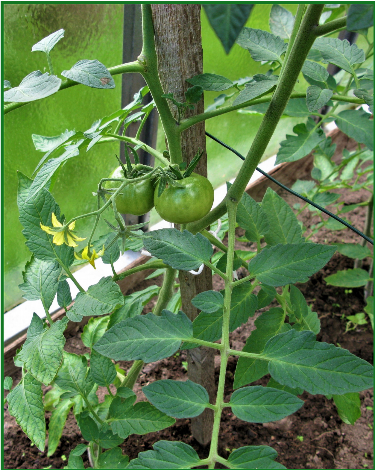
Rajčátka již začínají růst, ale ještě to bude trvat dlouho než uzrají