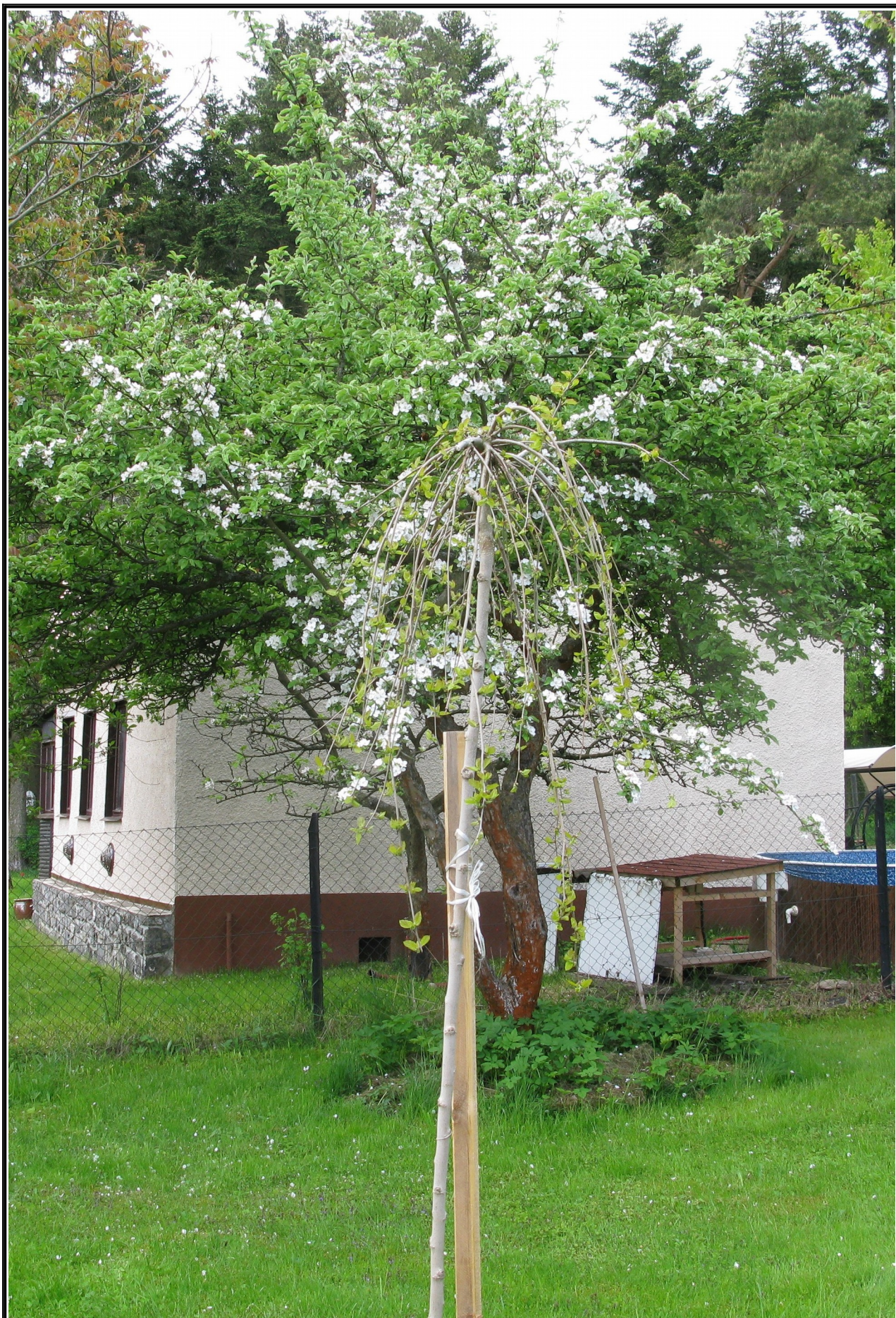
Tak to je moje Moruše, sázená na počátku dubna. Ale již začíná kvést