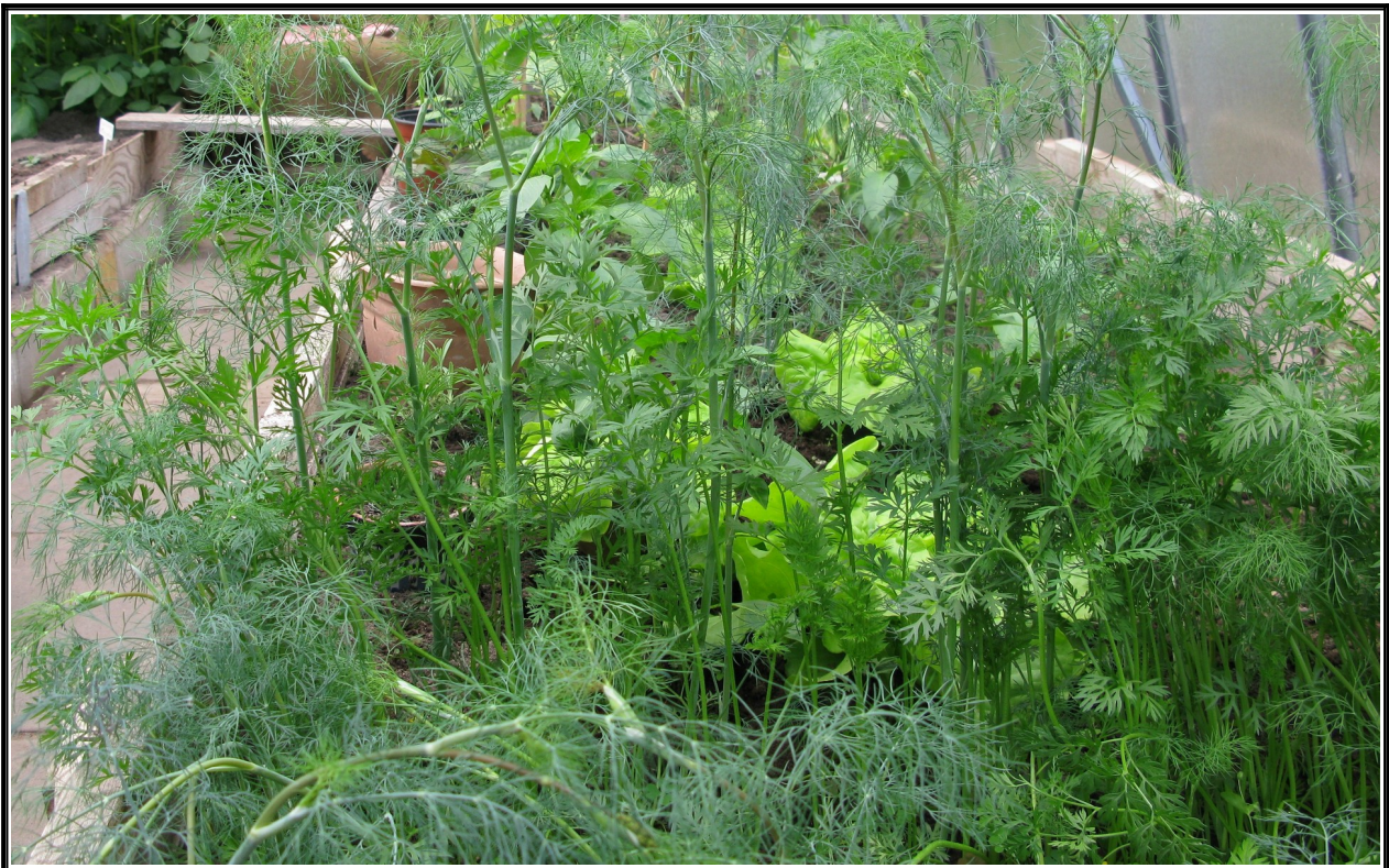
Papriky jsem sázel později, mám také spoustu kopru a vařím Koprovku polévku